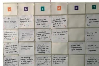
Example: OPERA workboard

COHERENCE Checking the plan details up Check if your objectives are coherent Do they fit together and support each other? Do they fit together and support each other? Do they fit together and support each other? Do they fit together and support each other?