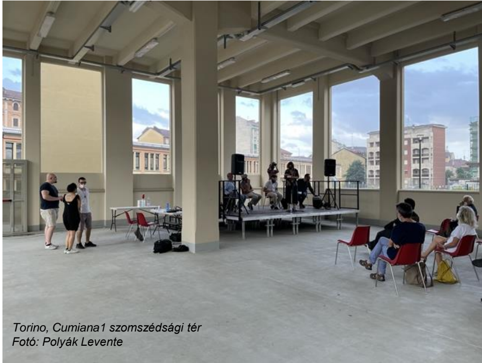
Torino, Cumiana1 szomszédsági tér