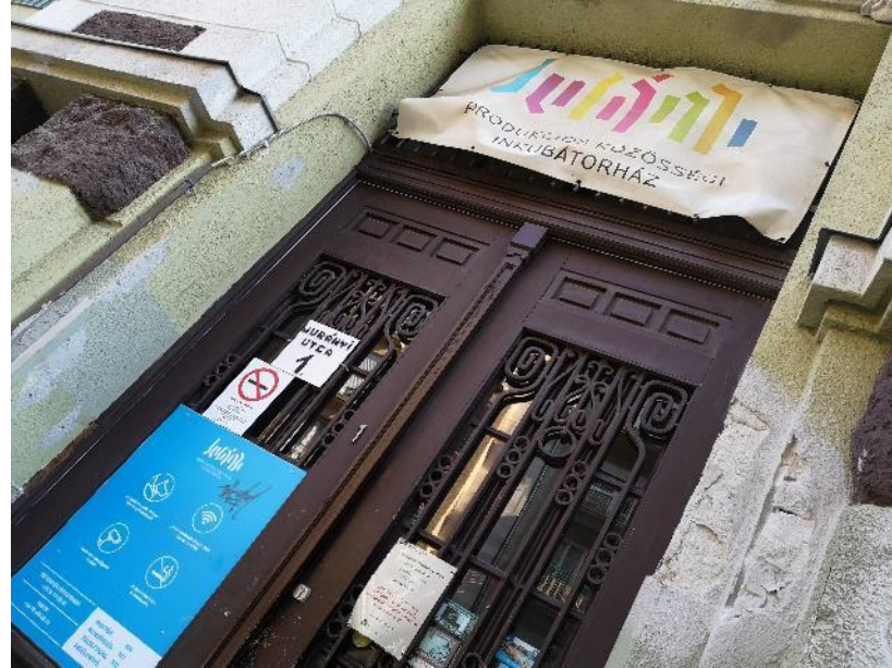
Jurányi Produkciós Közösségi Inkubátorház, 2021